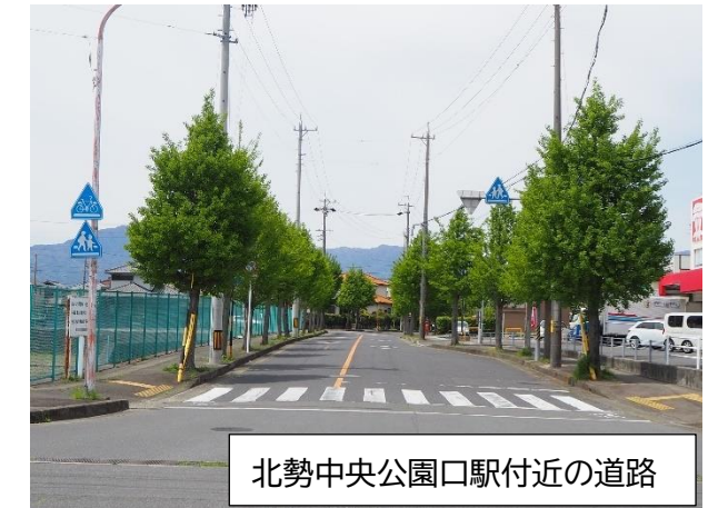
北勢中央公園口駅付近の道路