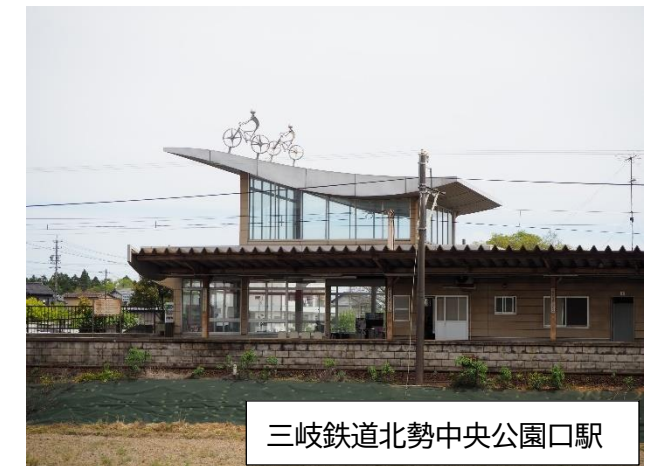
三岐鉄道北勢中央公園口駅