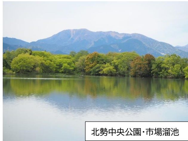
北勢中央公園・市場溜池