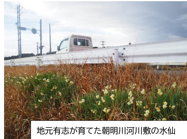
地元有志が育てた朝明川河川敷の水仙