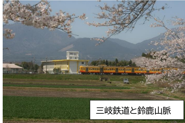
三岐鉄道と鈴鹿山脈