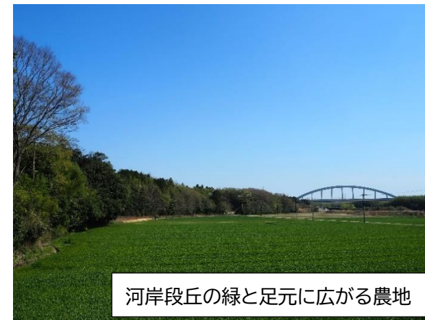
河岸段丘の緑と足元に広がる農地