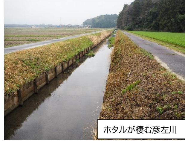
ホタルが棲む彦左川