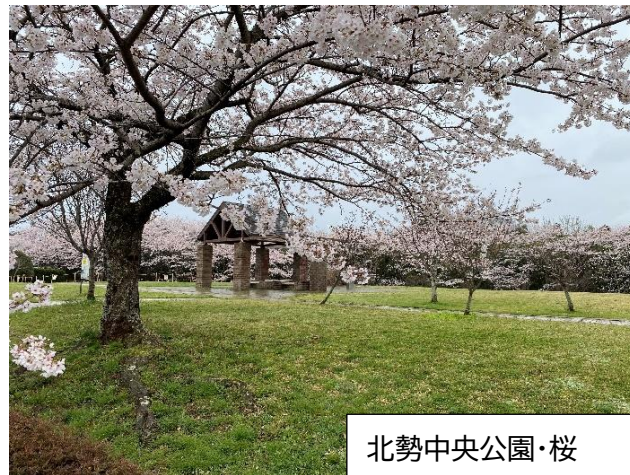
北勢中央公園・桜